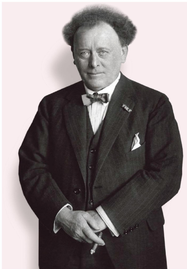
Willem Mengelberg, circa 1925